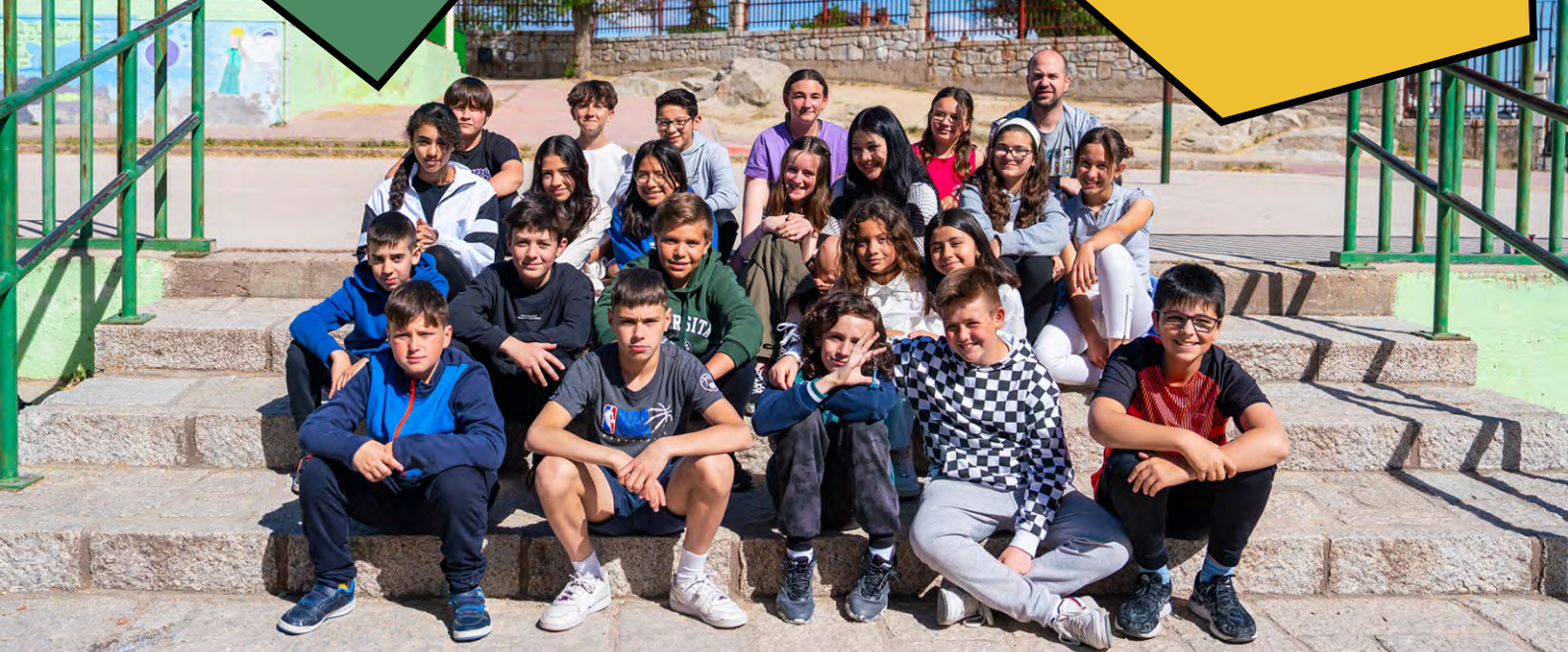
Colegio San Andrés