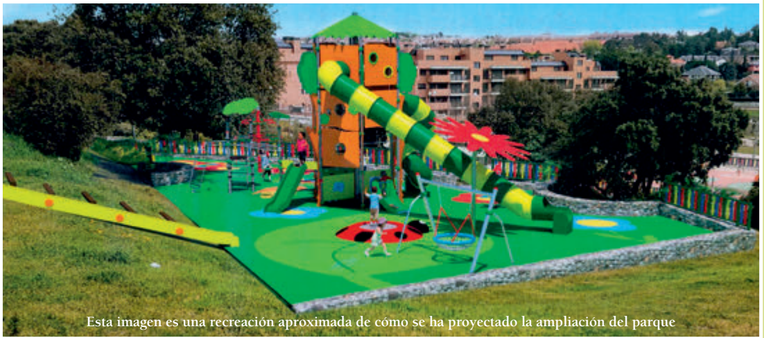
Esta imagen es una recreación aproximada de cómo se ha proyectado la ampliación del parque

El parque de la calle Transiberiano, en el barrio de La Estación, comenzará a crecer este mes de octubre después de que la Junta de Gobierno Local del Ayuntamiento aprobara el pasado 21 de septiembre la adjudicación del proyecto de su ampliación, una actuación con un presupuesto de 158.389 € y un plazo de ejecución previsto de cuatro semanas.