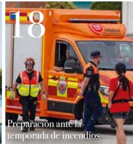
18 Preparación ante la temporada de incendios