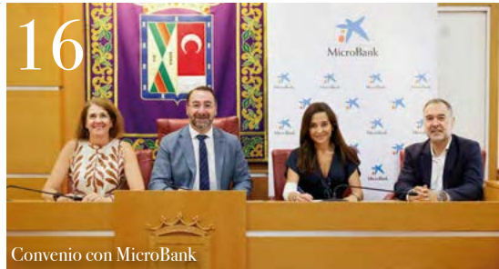
16 Convenio con MicroBank