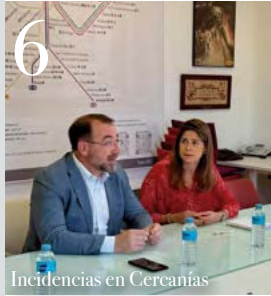
6 Incidencias en Cercantías