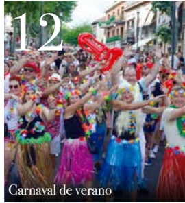
12 Carnaval de verano