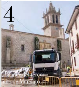
4 Balance del tercer año de Mandato