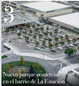
3 Nuevo parque comercial en el barrio de La Estación