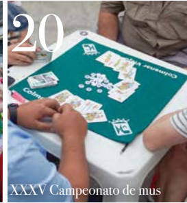
20 XXXV Campeonato de mus