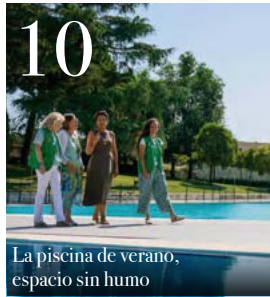
10 La piscina de verano, espacio sin humo