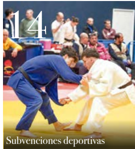
14 Subvenciones deportivas