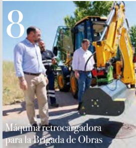
8 Máquina retrocargadora para la Brigada de Obras