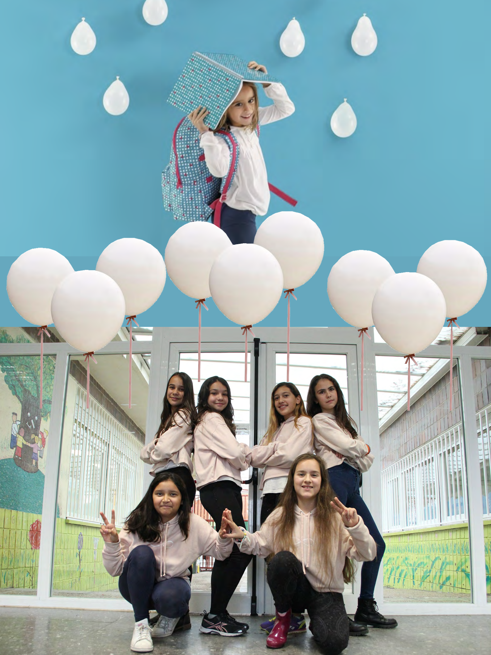
Colegio San Andrés