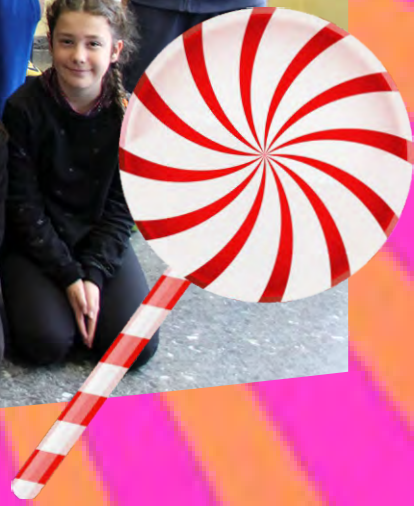
Colegio San Andrés